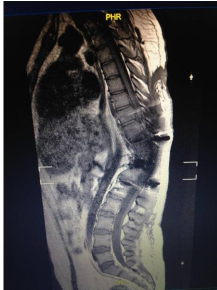
Figura 2. Imagen radiológica de ISQ tras fusión dorsal vía posterior con sistema de fijación transpedicular con extensión hacia el espacio del órgano.

Se aislaron bacilos Gram – (45%) y Gram + (45%) en el mismo porcentaje de casos, siendo en la mayoría de las ocasiones negativos multirresistentes, principalmente Enterobacter cloacae (n=4), seguida de Escherichia coli (n=3), Pseudomona aeruginosa (n=1), Acinetobacter baumannii (n=1), Klebsiella pneumoniae (n=1) y Proteus mirabilis (n=1). El Staphylococcus aureus (n=5) fue el agente patógeno Gram + más frecuente, seguido de Enterococcus faecalis (n=4), Staphylococcus epidermidis (n=2) y Staphylococcus coagulasa negativo (n=1). Únicamente en dos ocasiones (10%) se halló un resultado negativo del cultivo realizado del exudado de la herida. La misma herida quirúrgica estuvo invadida por varios microorganismos a la vez en 4 casos.